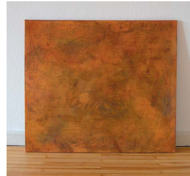
Ohne Titel Asche, Dispersion, Pigment, Malmittel auf Jute 105 x 120 cm, 2003