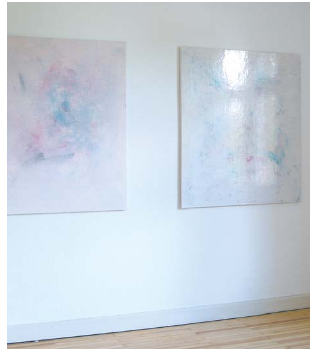
Ohne Titel Asche, Dispersion, Pigment, Malmittel auf Jute 120 x 105 cm, 2006

Altes Forstamt, Ensheimer Straße 4, 66 386 St. Ingbert Telefon: +49 (0)68 94/8 95 07 55 www.galeriebesch.de , i.besch@galeriebesch.de