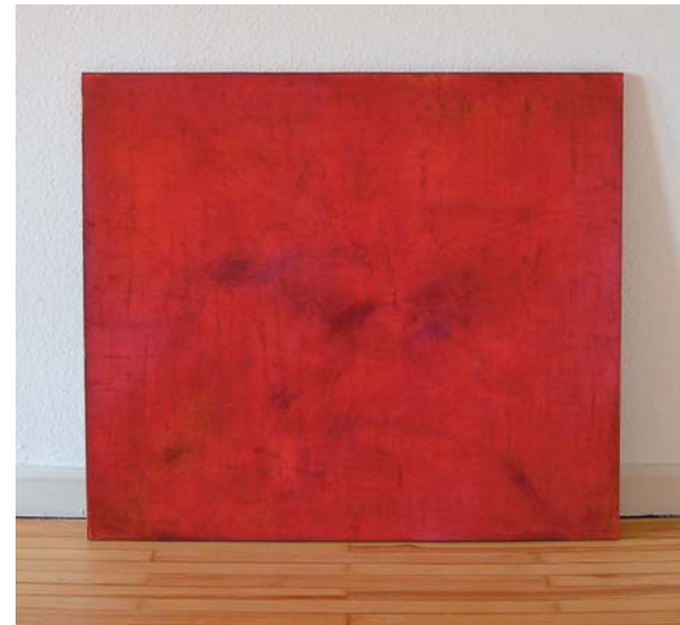
Ohne Titel Asche, Dispersion, Pigment, Malmittel auf Jute 105 x 120 cm, 2006

Das Haus ist am 1. Oktober von 10 bis 20 Uhr geöffnet.