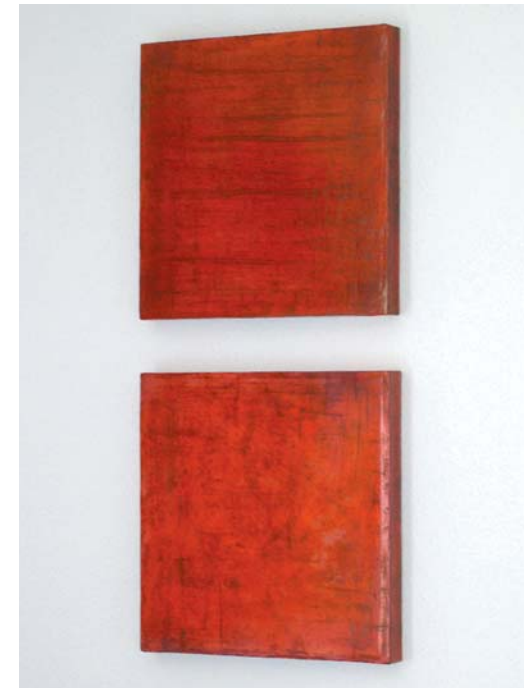
Ohne Titel Asche, Dispersion, Pigment, Malmittel auf Jute 50 x 50 cm, 2006